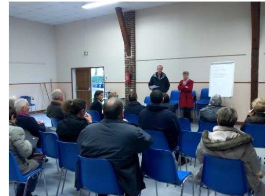
Nogent le Roi