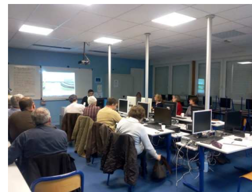
Châteauneuf en Thymerais