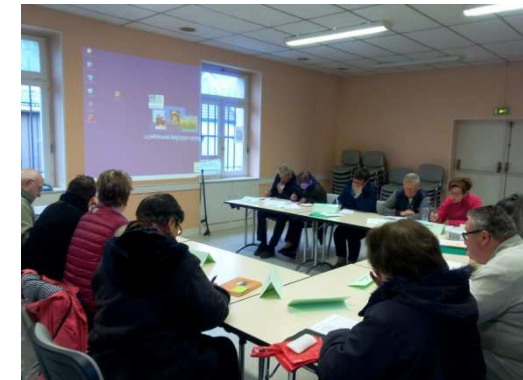
Nogent le Roi