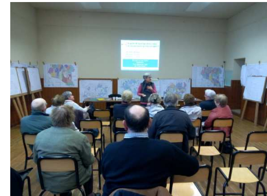
Saint Arnoult des Bois