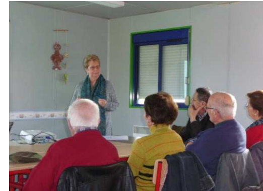
Nogent le Rotrou