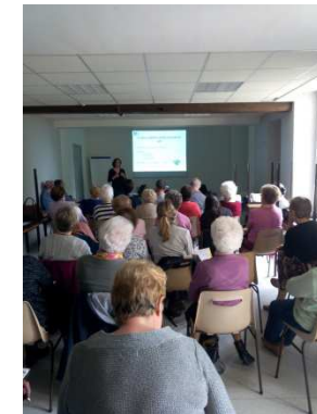
Nogent le Rotrou