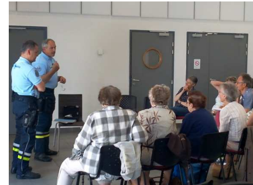
La Bazoches Gouët