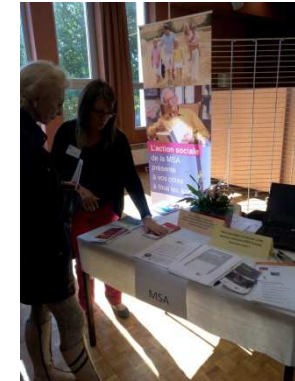
Nogent le Rotrou