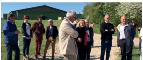
Ecuries du Val de L'Eure à Nogent sur Eure (Eure-et-Loir)