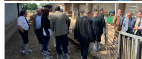
Institut national de la recherche agronomique (INRA) d'Osmoy dans le Cher