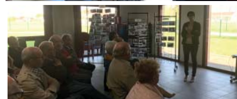
Maison Familiale et rurale d'Ascoux dans le Loiret

Retrouvez sur notre site internet l'ensemble des actions déployées : www.msa-beauce-coeurdeloire.fr