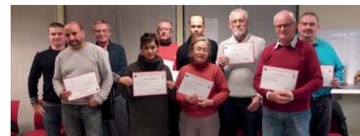
Des secouristes formés à Bourges (Cher)

C'est le nombre de personnes ayant assisté à ces actions en 2017, soit 430 de plus qu'en 2016