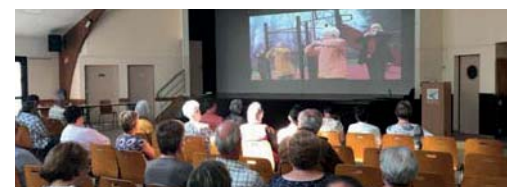
De futurs retraités au ciné-débat « Temps d'envies » à Dadonville (Loiret)