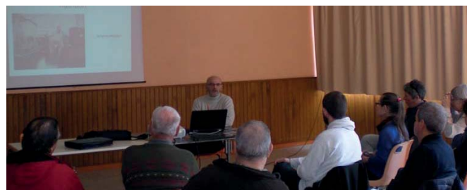
Conférence de Chateaumeillant en mars 2018

J'axe également mon propos sur la nutrition et j'en profite pour décrypter certaines allégations telles qu'« allégé en matières grasses » ou en faisant état de dernières études. Celle relative aux édulcorants révèle un effet sur la flore intestinale, dont l'importance sur le fonctionnement de notre organisme est de plus en plus mise en évidence. Des pistes évoquent même un lien avec l'obésité.