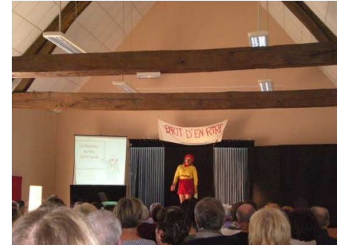
A LOYE SUR ARNON