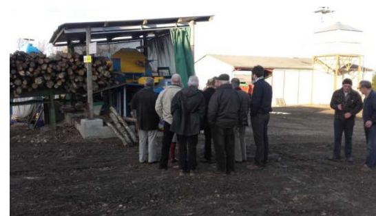
A MARSEILLES LES AUBIGNY