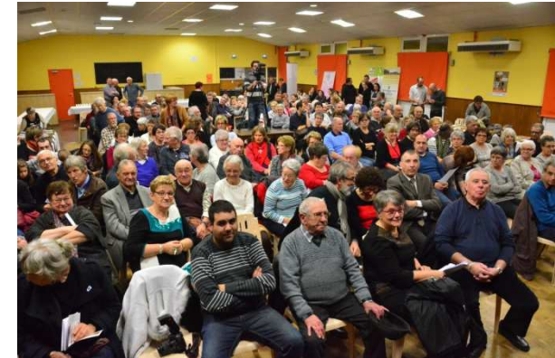
A LE CHATELET