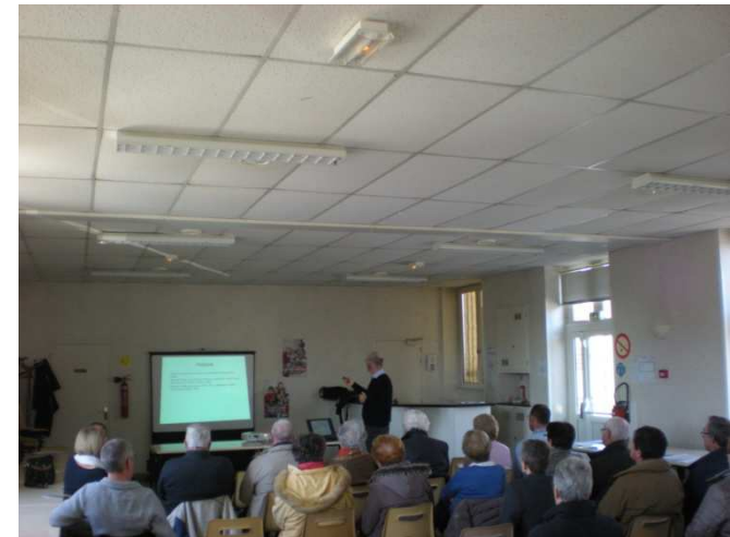
A ST MARTIN DES CHAMPS