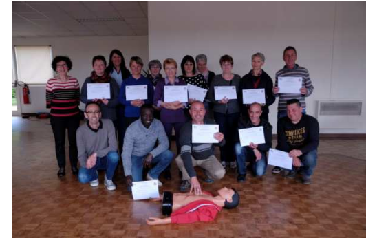
A ST PIERRE LES ETIEUX