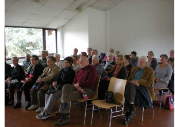
A ST DOULCHARD