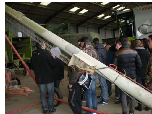
Saint Martin sur Ocre