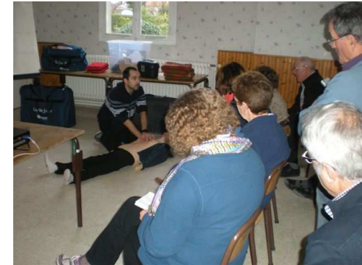
Saint Hilaire Saint Mesmin