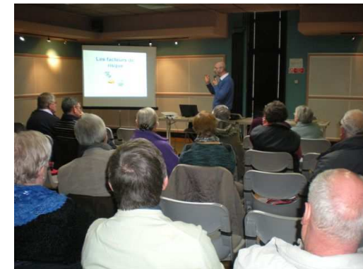
Châteauneuf sur Loire