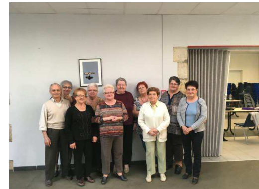
Ouzouer sur Trezee