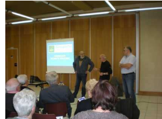
Bonny sur Loire