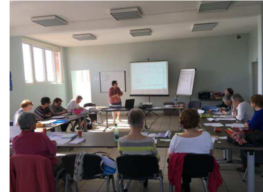
PEPS Châteauneuf sur Loire