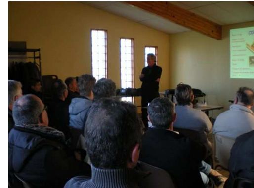
Gondreville la Franche