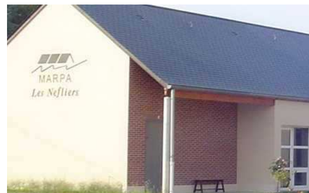
MARPA de Nesploy