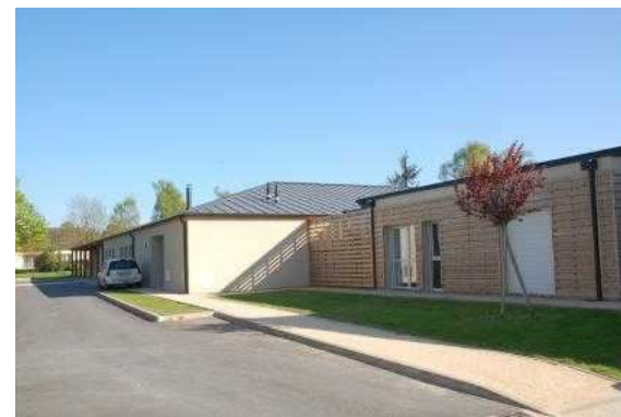
MARPA Chilleurs aux Bois