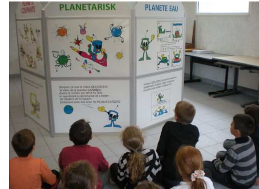
Epieds en Beauce